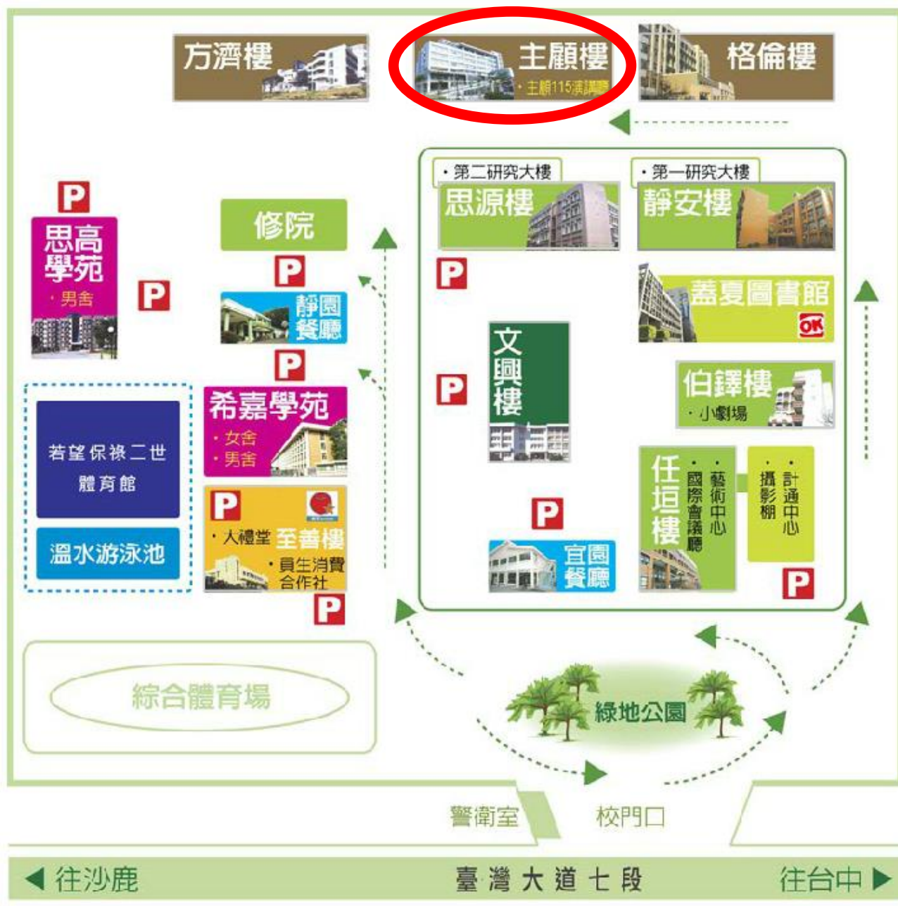
【靜宜大學校區配置圖】